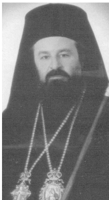
Μητροπολίτης Δράμας Παύλος

Η «Καμπάνα του Πόντου» δημοσιεύτηκε στο πρώτο τεύχος της «Ποντιακής Εστίας» που κυκλοφόρησε τον Ιανουάριο του 19850. Συγκίνησε τον ποντικό κόσμο και απέσπασε ευμενέστερες κριτικές.